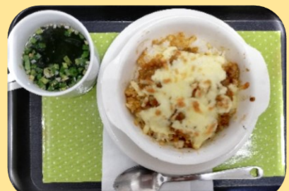
カレードリア 400円 (スープ付)

*「コミュニティカフェGREEN」は「社会福祉法人かがやき神戸」の「就労継続支援事業B型ミニなでしこ」が運営しています。