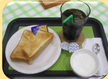
トーストセット 300円 (トースト+ドリンク+デザート)