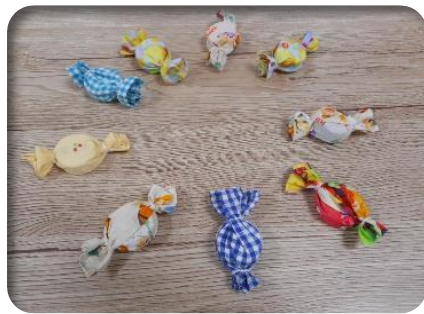
創作活動で ペットボトルマグネットを 作りました♪

さて、デイケアでは夏に向けて外での活動を増やして、体を動かすプログラムや外出を考えておりますので、興味のある方はいつでも声をかけてください。スタッフ一同、お待ちしております。