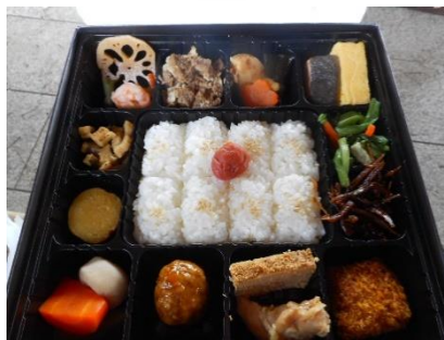
西神中央公園で お花見をしました